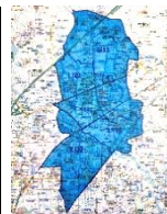
↑ポスティング完了エリア(茨木市全世帯の16.3%)